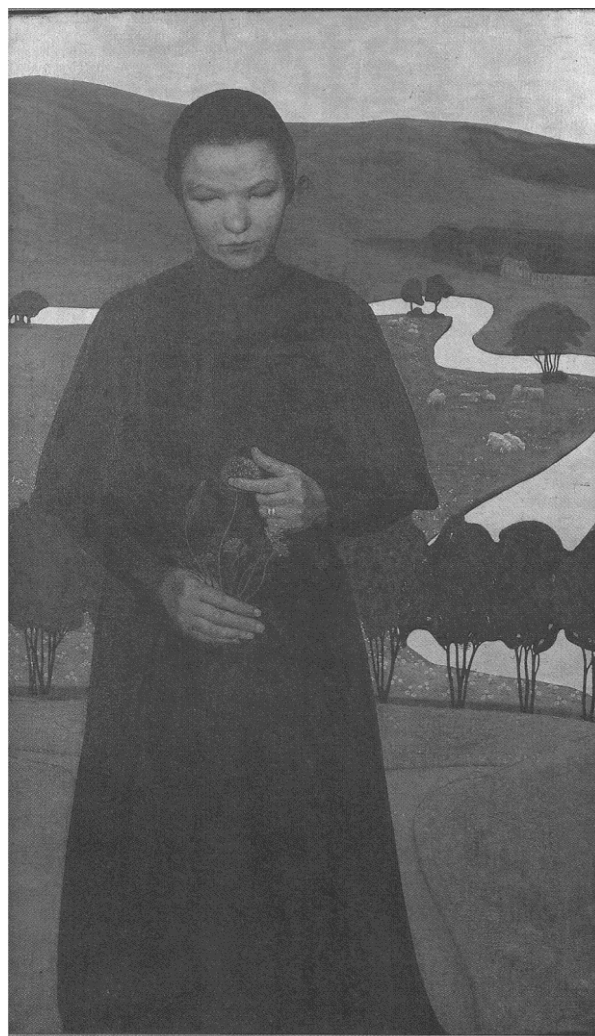
Den blinde pige, malet af Ejner Nielsen, 1896-98 (Den Hirschsprungske Samling)

års alderen rantes hun af en kirtelsygdom i øjnene, der efterhånden gjorde hende helt blind.