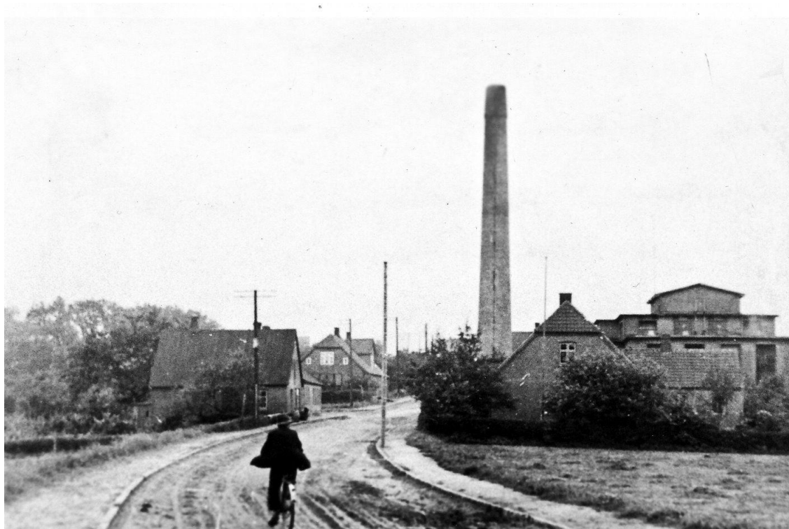
Bødkerværkstedet ca. 1940