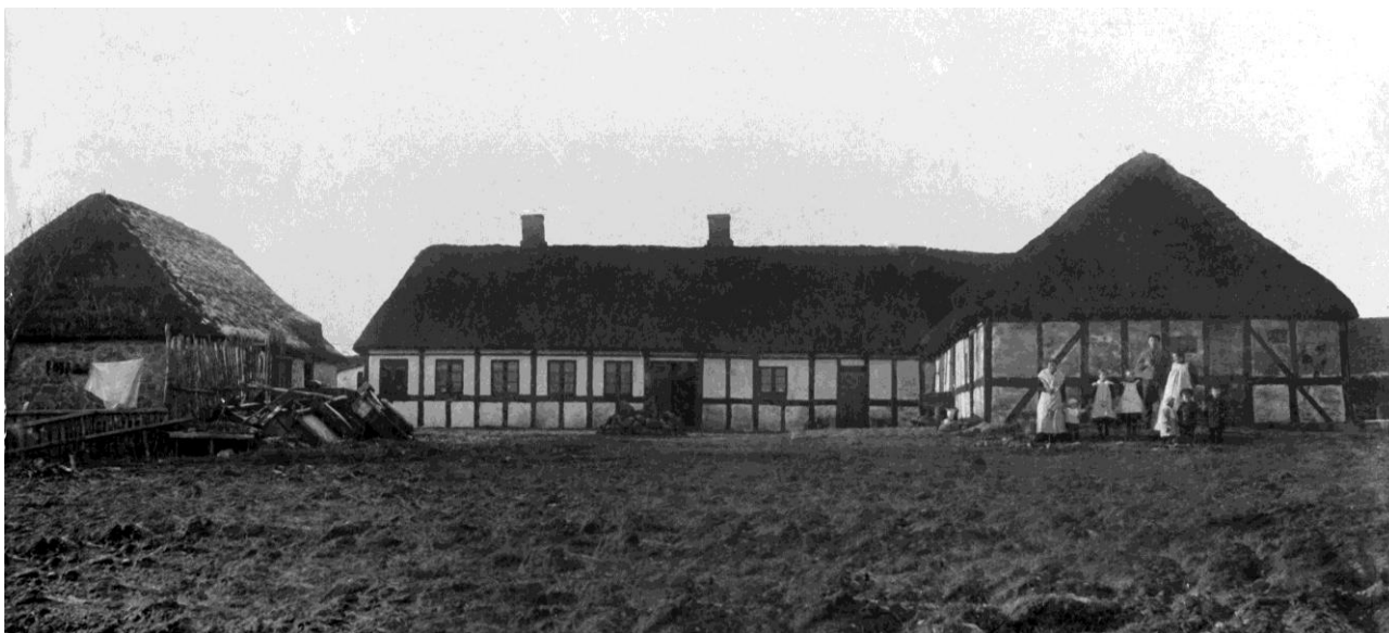
Djævlemosegård ca. 1912