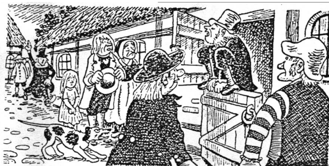
Herremanden paa Grauballegaard gik igen

Pælen stod der i mange år og det fortælles at når nogen rokkede med pælen lød det nede fra dybet: Rok bedre op, rok bedre op.