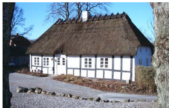
Den første skole i Grønbæk.