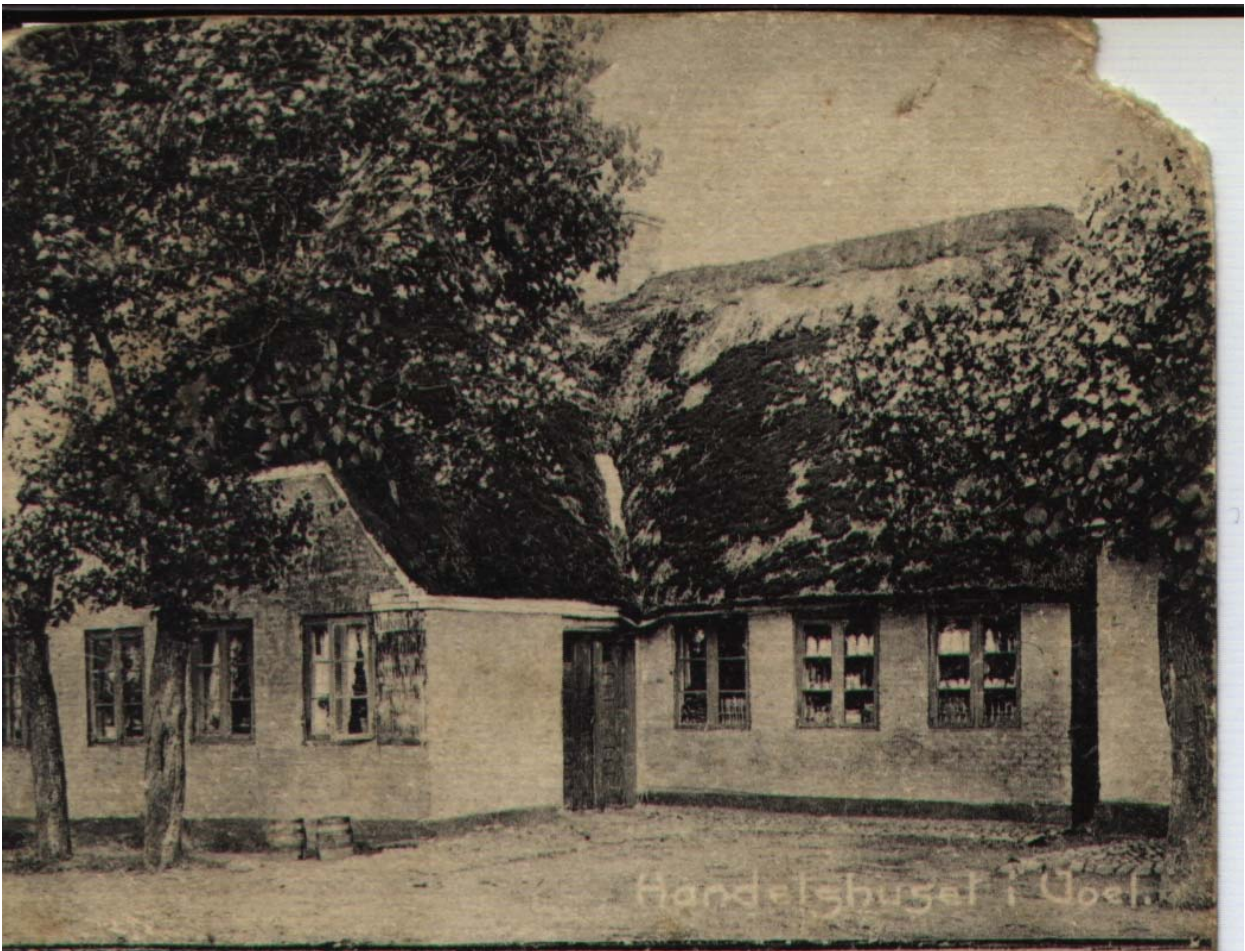
Den gamle skole i Voel

6. Det er blot Skolebygningen som bortsælges, allsaa er undtaget alt sømfast Inventarium, ogsaa hvad som er nagel fast.