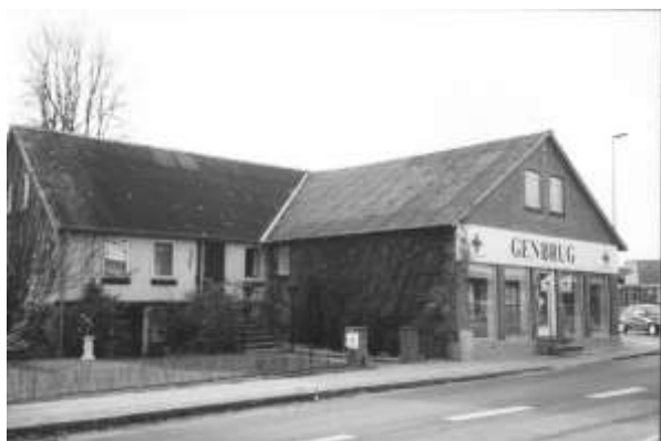
Forretningen på Hovedgaden i Sorring.