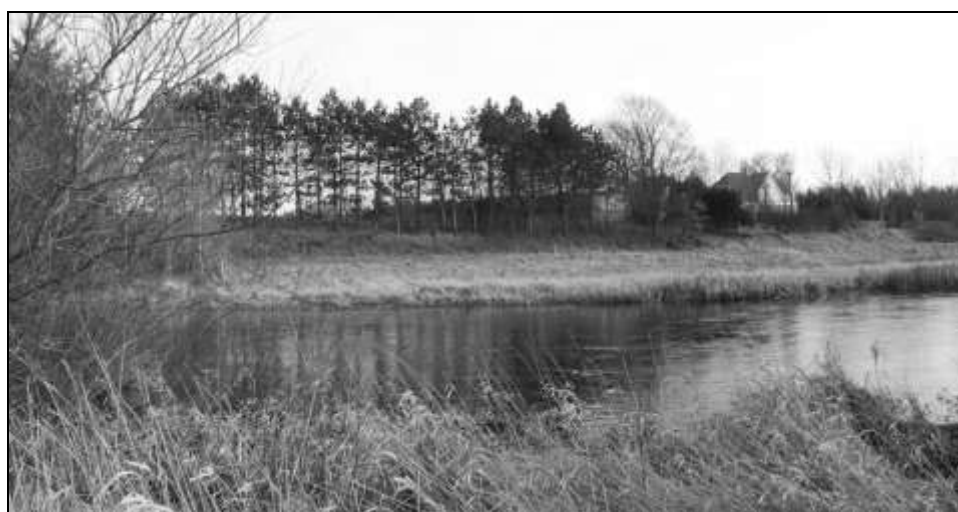
"Banken" i dag, - mon ikke navnet kommer af det plateau ejendommen ligger på?