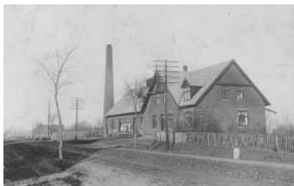
Fårvang mejeri ca. 1910