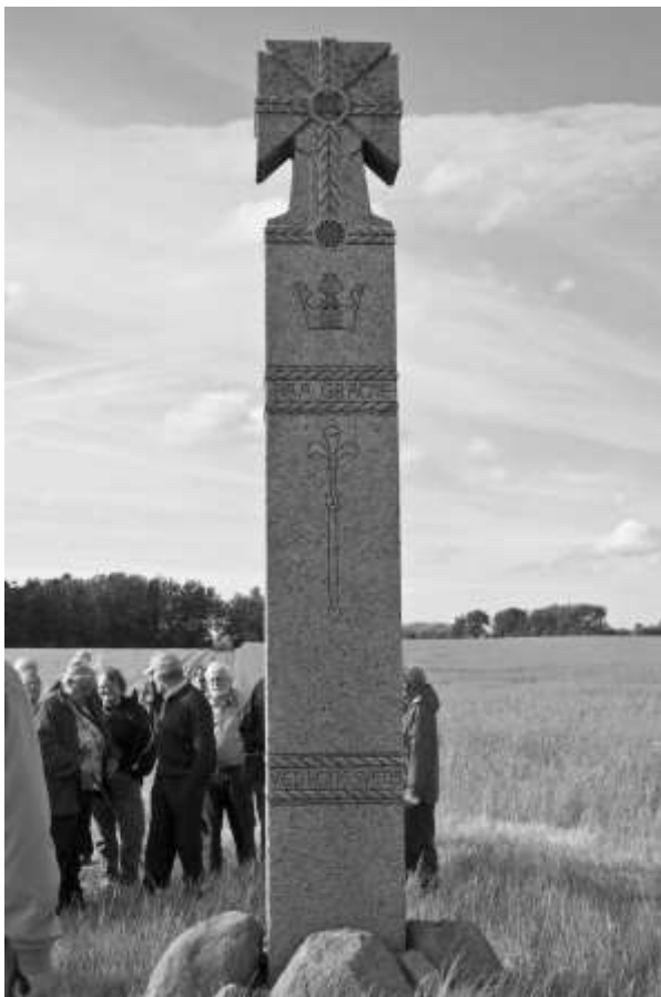
Udflugtsdeltagerne omkring monumentet på Grathe Hede

Vi lavede så lynhurtigt programmet om, så vi i stedet besøgte monumentet over slaget på Grathe Hede i 1157.