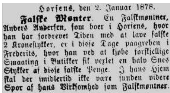
Horsens Folkeblad 2. januar 1878