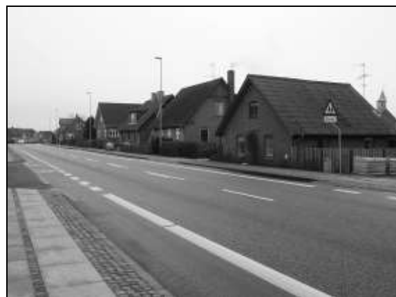
Hjortgårdsvej 28, Voel

Efter han ophørte med at drive kroen omkring 1924, flyttede han ind i et hus (Hjortgårdsvej 28), han havde bygget i udkanten af Voel by. Huset var bygget på et jordstykke, som havde været en del af krohaven.