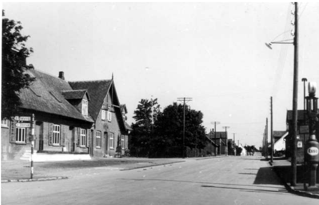
Storegade i Fårvang ca. 1920-1940