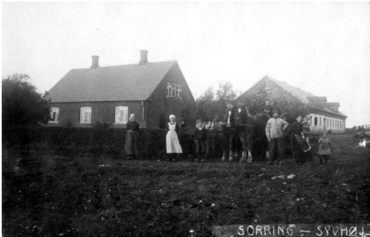
Ejendommen Syvhøj ved Sorring

Til den store gravhøj hører et sagn. Når solen på en bestemt dato sender stråler ud mod sydvest, skulle der et sted ude på Voel Østermark kunne graves en skat op.