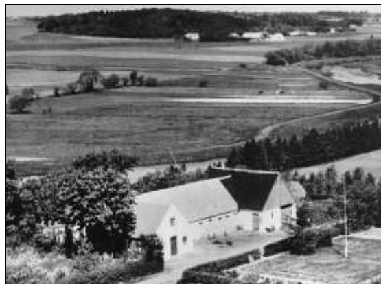
”Banken” - (med tilbygget lade,- hele ejd. er siden revet ned og genopbygget)

Det er tillige værd at bemærke, at retssystemet også den gang gjorde sig umage for at få oplyst en sag grundigt. Selv om det var før begrebet retssikkerhed blev moderne, ønskede man ikke at dømme uskyldige.