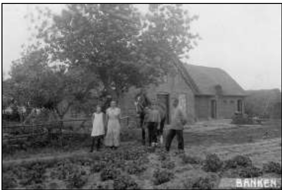
”Banken” ca 1913

Det siges, at ejendommen har fået dette navn, fordi der her har boet en person, som fremstillede falske penge.