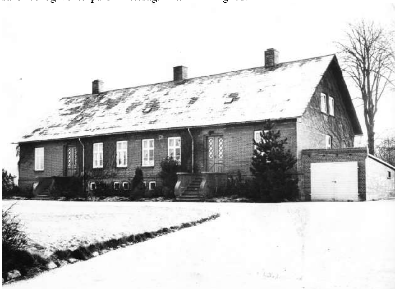
Dette er et billede af den forrige præstebolig i Gjærn. Den blev opført i 1881 efter en brand, hvor både præstegården og to andre huse brændte ned.

sten har medlidenhed med ”den arme synderinde” og beder om, at hun må være i portstuen. Han fremfører ligeledes, at det er hendes ungdoms tåbelighed, der har ført hende i fortræd; ikke hendes forsætlige ondskab og ugudelighed.