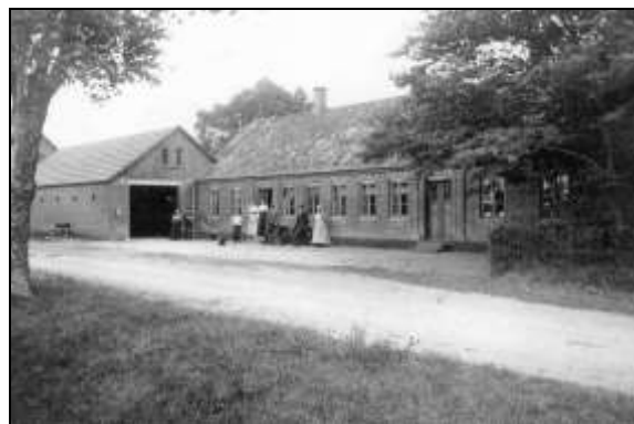
Voel kro 1912 Det er AA på trappen

holdning til alkohol for i 1917 meddelte han iflg Næringsprotokollen til Silkeborg By og Birk, at han fra 30. september ikke handler med brændevin